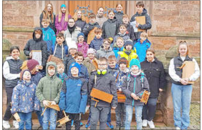
Die Klepperer vor der katholischen Kirche im April 2023.