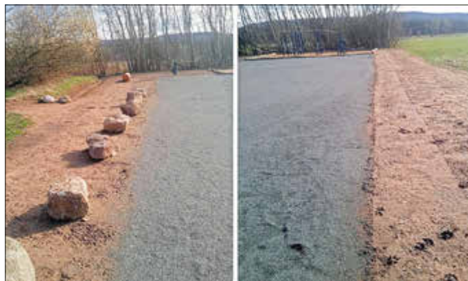
Rasensaat und Begrenzung der Parkplatzflächen am Naherholungspark Krämel.