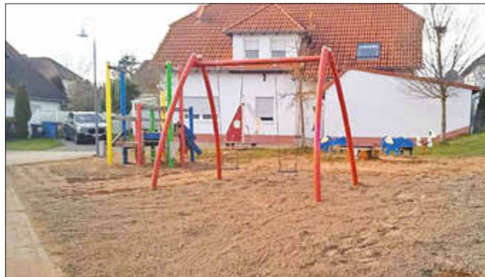
Neuanlage der Rasenkante und Nachfüllen von Sand am Spielplatz Langgewanne.

Über die Jahre sind die Grasnarben dort immer höher geworden, sodass ein erneutes Einebnen und Anlegen der Rasenflächen erforderlich wurde. Die Stolpergefahr ist dadurch gebannt und mit einsetzendem Frühling kann die Anlage wieder uneingeschränkt genutzt werden. Darüber hinaus werden neu angelegte Flächen eingesät, wie beispielsweise um die Calisthenics-Anlage und den Wanderparkplatz am Naherholungspark Krämel.