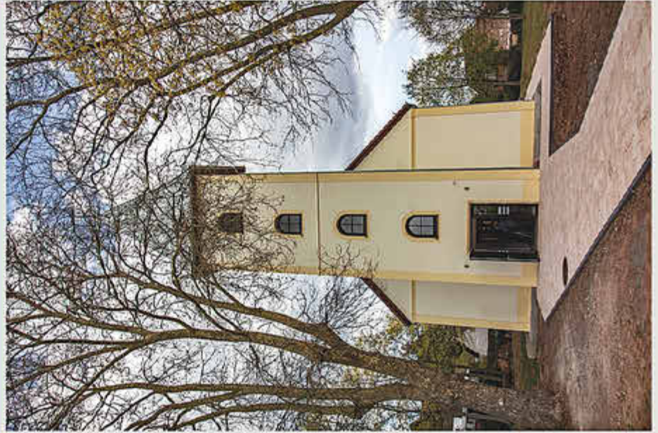
KOLUMBARIUM RAMSTEIN-MIESENBACH URNEKIRCHE

Wenn Sie einen Platz im „Kolumbarium Urnenkirche“ erwerben wollen, gehen Sie bitte wie folgt vor: Benutzen Sie das dafür vorgesehene Antragsformular. Füllen Sie es aus (gerne sind wir Ihnen dabei behilflich) und schicken es an / oder geben es ab bei: Verbandsgemeindeverwaltung Ramstein-Miesenbach Friedhofsverwaltung Am Neuen Markt 6 666877 Ramstein-Miesenbach