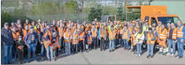
Auf viele fleißige Helferinnen und Helfer hofft die Stadt auch in diesem Jahr bei der Gemarkungsreinigung.