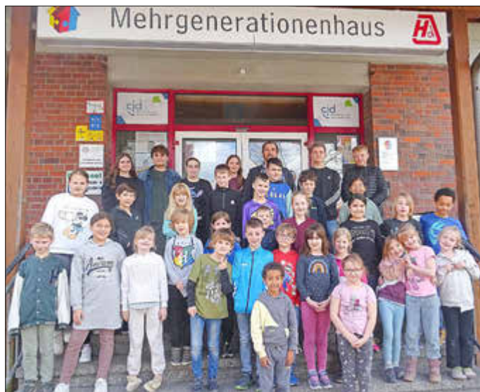
Gruppenbild mit Betreuern vor dem MGH Ramstein. Mehrgenerationenhaus Ramstein

Es wurden Schlüsselanhänger aus Schrumppfolie gestaltet, Grußkarten bestickt oder Küken und kleine Dinos im Ei gebastelt. Täglich gab es außer dem 3-Gänge-Menü, das über die Seniorenresidenz St. Josef bezogen wurde und allen sehr lecker schmeckte, zur Kaffeezeit noch Selbstgebackenes aus einem Workshop. Karottenkuchen, vegane Schoko-Cookies, Pizzaschnecken und Ostergebäck kamen sowohl bei den Kindern als auch bei den Betreuern sehr gut an.