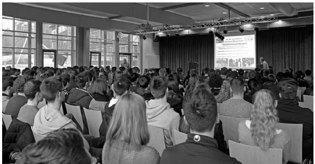
Die Schülerinnen und Schüler der Oberstufe des Reichswald-Gymnasiums Ramstein-Miesenbach erhielten einen Vortrag zum Rheinland-Pfalz-Tag mit der Bitte, sich als Ehrenamtliche zu engagieren.

www.ramstein-2015.de www.facebook.de/ramstein2015