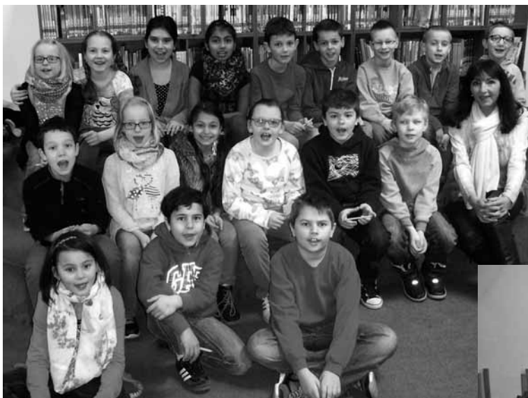
Auch die 3d der Ramsteiner Wendelinusschule erwarb den Bibliotheksführerschein.