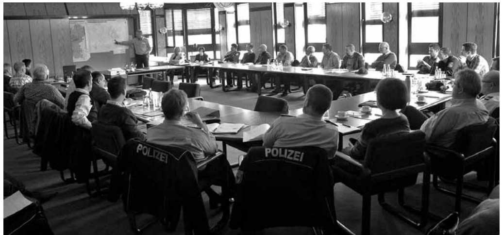
Fragen der Sicherheit wurden im Sitzungssaal in großer Runde besprochen.

Werben für das Landesfest soll auch ein Film des Jugendbüros der Verbandsgemeinde Ramstein-Miesenbach, der nochmals überarbeitet wurde. In ihm laden Menschen aus vielen verschiedenen Nationen in ihren Landessprachen Gäste und Besucher zum Rheinland-Pfalz-Tag ein.