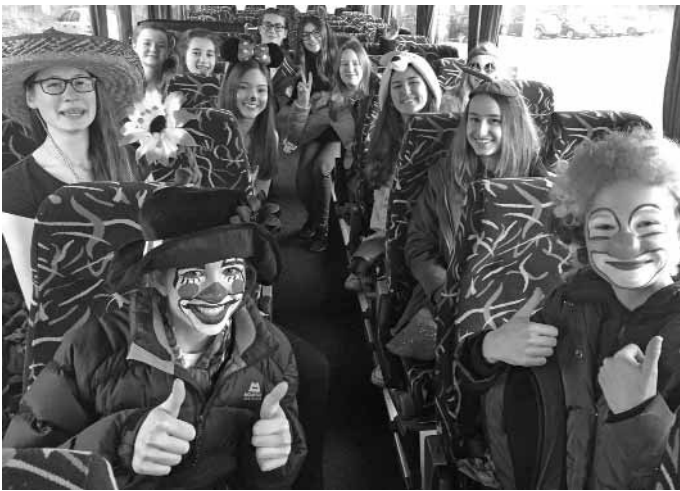
Die Miteinander AG des Reichswald-Gymnasiums auf dem Weg zum Faschnachtsfeier der Reha-Förderschule (Foto: Reichswald-Gymnasium).