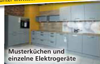
Musterküchen und einzelne Elektrogeräte

Die Versteigerung beim Einrichtungsmarkt das fröhliche m GmbH, Richard-Wagner-Straße 24 in 66424 Homburg/Saar beginnt am Freitag, den 20.04.18 und endet am Montag, den 23.04.18. Versteigerungszeiten sind am Freitag, Samstag und Montag von 12.00 bis