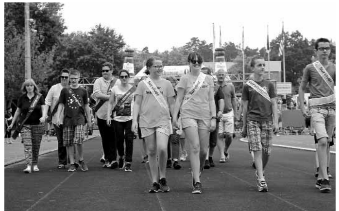
Bei der Eröffnungsrunde spielte das Wetter noch mit.

Weitere Informationen unter www.ib-freiwilligendienste.de