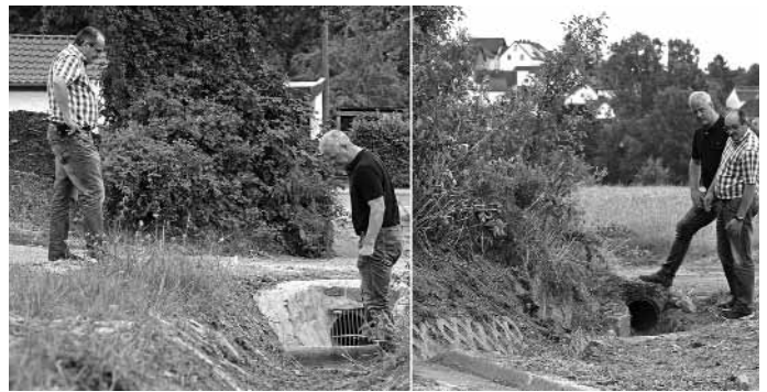
Das linke Foto zeigt die neue Wasserführung in der Ortsgemeinde Niedermohr, das rechte Foto die neue im Stadtteil Miesenbach.