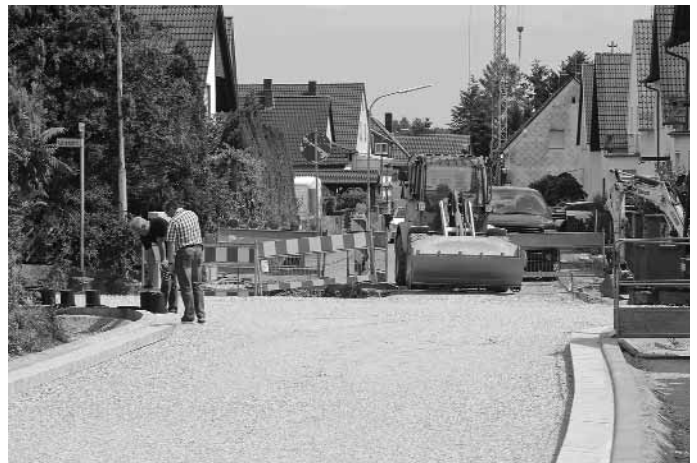
Die Straßenbauarbeiten im Stadtteil Ramstein laufen derzeit ebenfalls auf Hochtouren.

Während der Ferienzeit finden im kompletten Bereich der Verbandsgemeinde Bautätigkeiten und Renovierungsarbeiten statt. Ob in unseren Schulen, den Kindertagesstätten oder im Straßenbau: überall wird kräftig gearbeitet und es geht gut voran. In der Ortslage Niedermohr wurde nach den Starkregenereignissen die Wasserführung neu gefasst und auch in Miesenbach, im Bereich Feldstraße, wurden wie an vielen weiteren Stellen ebenfalls die Außenentwässerung optimiert und die Wirtschaftswege ertüchtigt. Eine hervorragende Arbeit unserer Männer vom Bauhof der Verbandsgemeinde Ramstein-Miesenbach.