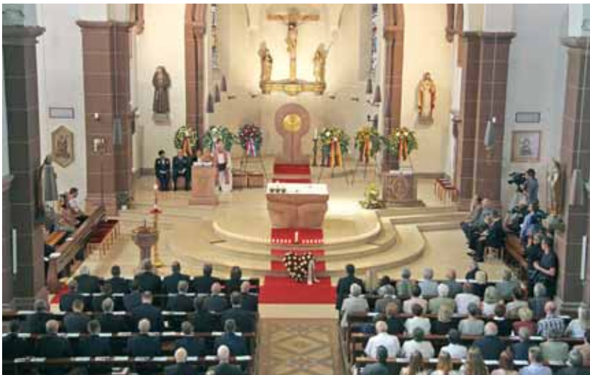
70 Kerzen um den Altar standen für die 70 Opfer der Flugtagkatastrophe.