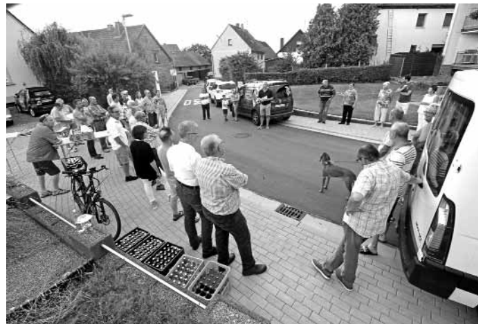
... anschließend ging es danach in die Eckstraße, wo nach der kurzen Rede zu einem kleinen Umtrunk geladen wurde.

Weitere Informationen unter „www.stadt-land-spielt.de“ und „www.buecherei-ramstein.de“, Telefon 06371-592-221.