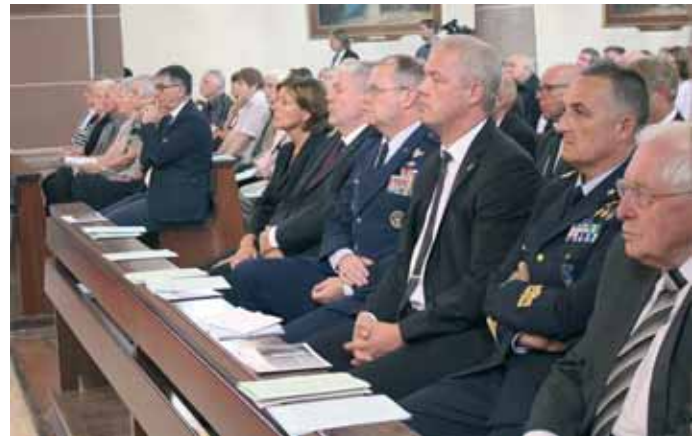
Über 100 Angehörige von Opfern der Flugtagkatastrophe und zahlreiche Ehrengäste wohnten der Gedenkfeier in der katholischen Kirche in Ramstein bei.

An der Gedenkfeier mit anschließendem Gottesdienst nahmen unter anderem auch Ministerpräsidentin Malu Dreyer teil sowie die ehemaligen Ministerpräsidenten Kurt Beck und Bernhard Vogel, der ebenso wie die Ministerpräsidentin ein Grußwort sprach. Er werde, so Vogel, den 28. August 1988 niemals