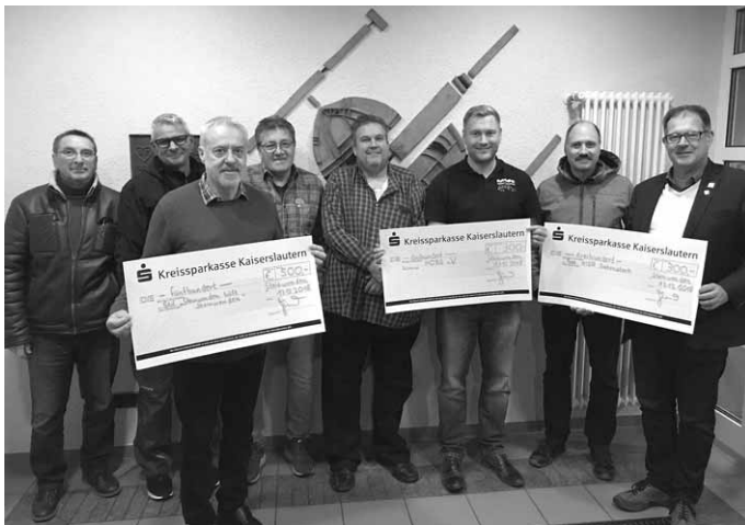
Unser Bild zeigt die Vereinsvertreter zusammen mit den Verantwortlichen der bedachten Vereinen und Institutionen.