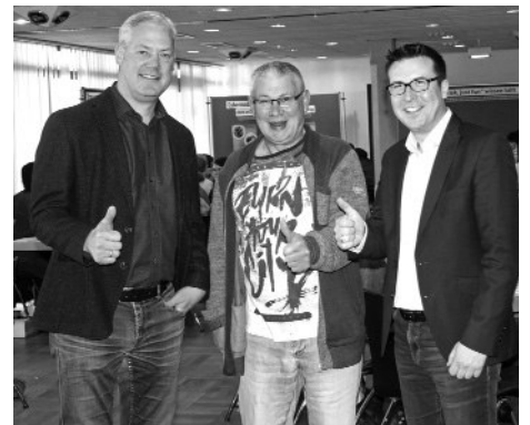
Impressionen der 10. Jugendschutztage aus dem Jugend- und Seniorenraum im Congress Center Ramstein:

Bereits im 10. Jahr waren die diesjährigen Jugendschutztage des Jugendbüros für 400 Schüler/Innen der Realschule plus am Reichswald, des Reichswald-Gymnasiums und einer Klasse der Nikolaus-von-Weis-Schule optimal besucht. Über Alkohol und Drogen, Cybermobbing und Zivilcourage, Hasskommentare, Schutz der eigenen Intimität, Gewalt in sozialen Beziehungen, sexuell übertragbare Erkrankungen, Selbstverteidigung, Neonazis und menschenverachtenden Strömungen und das Jugendschutzgesetz informierten und diskutierten über 20 Referenten von der Polizeiinspektion Landstuhl, der Jugend- und Drogenberatung „release“, von medien&bildung, Caritaszentrum Kaiserslautern, Diakonie Pfalz, AIDS-Hilfe Kaiserslautern, SOS Familienhilfezentrum, Kampfkunst Herz, Netzwerk für Demokratie und Courage und Teams des Jugendbüros mit den jungen Leuten. Wertvolle Impulse für die eigene Meinungsbildung aber auch für die eigene Charakterentwicklung wurden durch die einfühlsame Art und Weise der Referenten gesetzt. Finanziell unterstützt werden die Jugendschutz-Aktionstage vom Kreisjugendamt Kaiserslautern, dem Landesjugendamt Rheinland-Pfalz und der Leitstelle Kriminalprävention des Landes Rheinland-Pfalz.