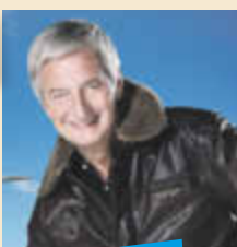
Live-Show Abenteuer Weltumrundung

Ausführlicher Reiseverlauf unter: www.schlagernacht-namibia.de