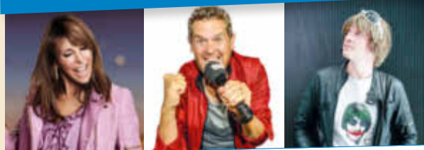
Ireen Sheer, Peter Wackel und Mickie Krause