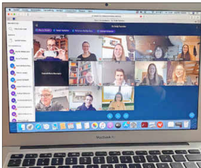
Per Videokonferenz wurde die Spende vereinbart und an die Hilfsorganisation MATI übergeben

Seit vielen Jahren arbeitet das Ramsteiner Reichswald-Gymnasium mit der Hilfsorganisation MATI zusammen. Der Verein kümmert sich um die Förderung und Unterstützung eines Dorfes im ländlichen Bangladesch.