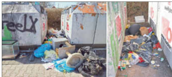
Erschreckender Anblick: große Mengen an Abfall wurden rund um die Glascontainer abgeladen.

gung überlassen. Es ist leider immer wieder erschreckend zu sehen, zu welchen Schweinereien manche Menschen fähig sind, die ihre Abfälle auf Kosten der Allgemeinheit an solchen Containerstandplätzen oder in der Natur entsorgen, ob aus Gleichgültigkeit oder mit Vorsatz. Beides ist verwerflich und sicherlich auch eine Frage der Erziehung und des Charakters. Hier fehlt es wohl an beidem! Der Müll muss auch hier entsorgt werden und dies bezahlt die Allgemeinheit mit erhöhten Müllgebühren. Wir fordern alle Einwohner auf, die Augen offen zu halten, um herauszufinden, wer hier den Müll illegal entsorgt und diese Leute dann auch anzuzeigen! Helfen Sie mit, solche gewissenlosen Zeitgenossen ausfindig zu machen und zu bestrafen.