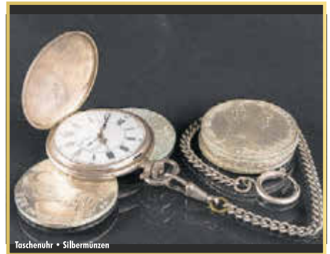
Taschenuhr • Silbermünzen

»Wecker« aus dem Tresor zu holen und diese den Experten vorzulegen. Laut Experten kann beispielsweise eine Rolex GMT Master aus den 70er Jahren bis zu 9.000 EUR erzielen. Des Weiteren bieten die Experten von »Bares für Wa(h)res« kostenlose Wertschätzung von Diamanten an. Besonders interessant sind Diamanten im Brillant-Schliff ab einer Größe von 0,50 Karat. Hier gilt immer die Faustregel: Ein einzelner großer Diamant ist wertvoller als viele kleine Diamanten. Ein Besuch bei den Experten lohnt sich in jedem Fall, denn hier wird Ihr Schatz professionell taxiert und zu einem fairen Preis entgegengenommen.