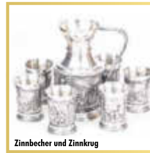
Zinnbecher und Zinnkrug