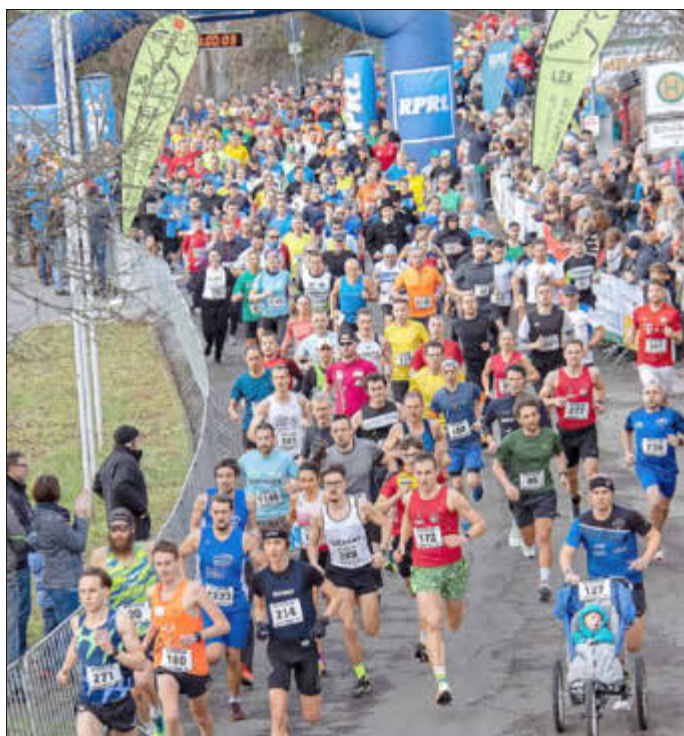
Fast 500 Teilnehmer absolvierten die 10 Kilometer lange Strecke. Schon kurz nach dem Start setzen sich die drei Erstplatzierten an die Spitze.