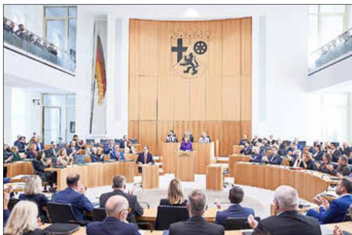
Der Landtag Rheinland-Pfalz gedachte der Opfer der Terrororganisation der Hamas mit einer Schweigeminute und bekundete seine Solidarität mit Israel.