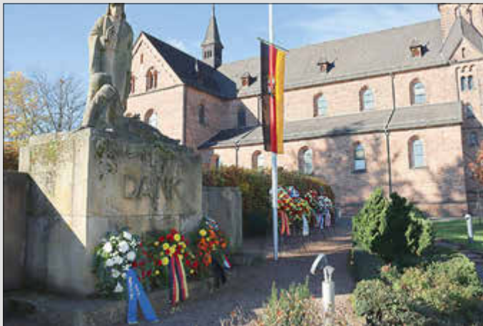
Das Ehrenmal an der katholischen Kirche in Ramstein. Eine von vielen Gedenkstätten für die Opfer der beiden Weltkriege in der Verbandsgemeinde.

Gedenkfeiern am Sonntag, 19. November 2023: