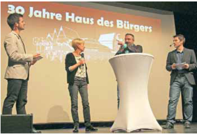
Die beiden Geschäftsführer im Interview mit den Moderatoren.