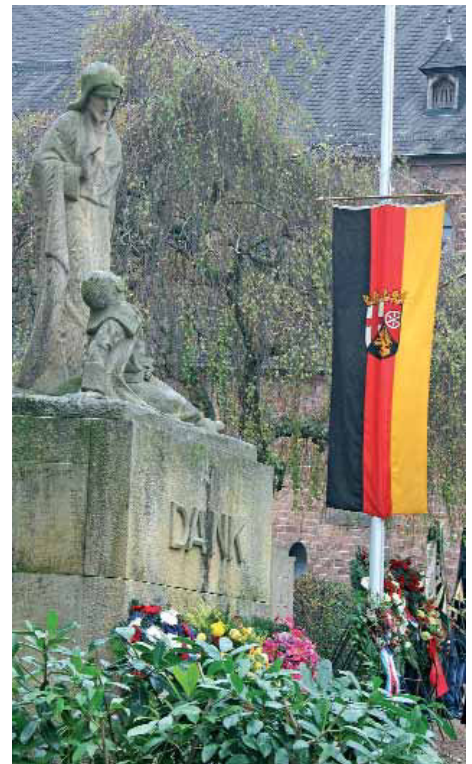
Ehrenmal in Ramstein.

Gemeinde Steinwenden: 11.15 Uhr am Denkmal in Obermohr