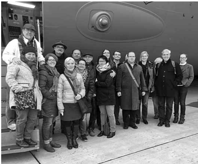
Mitglieder des Regionalverbandes Museumspädagogik Südwest und weitere Gäste beim Besuch der Air Base Ramstein.

Wir versprechen einen informativen Nachmittag und freuen uns auf ein Wiedersehen mit Ihnen.