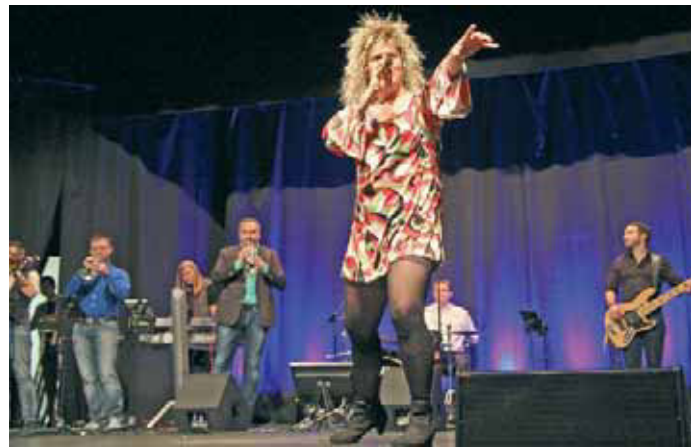
Auftritt von Superstar Tina Turner und den Habachtalern.