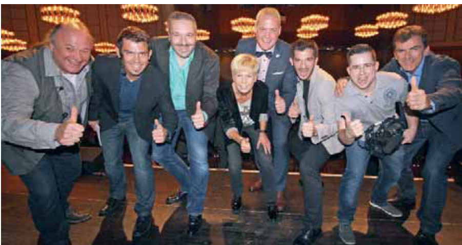
Geschafft: die Organisatoren des Abends am Ende der Show.