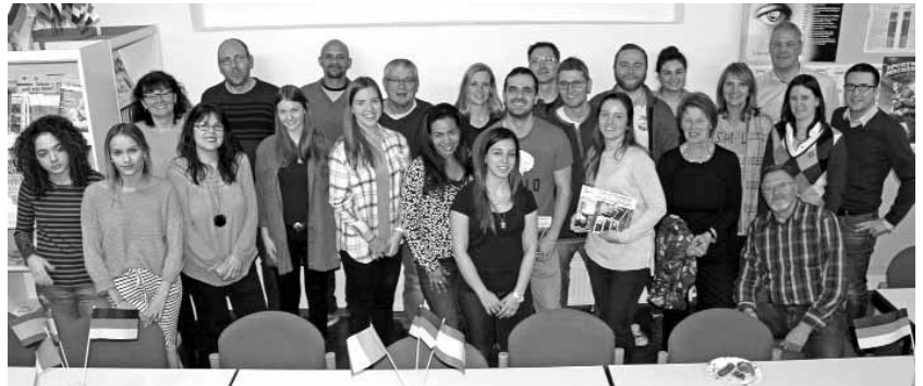
In großer Runde wurden die beiden Freiwilligendienstler im Jugendbüro verabschiedet (Fotos: St. Lays).

Die Internationale Basketballgruppe ist für alle zwischen 11 und 17