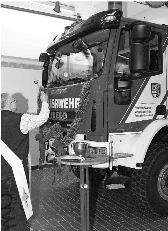
Diakon Martin Pletsch segnete das neue Fahrzeug der Feuerwehr Niedermohr (Foto: FW Niedermohr):

Infos im Internet unter: www.feuerwehr-ramstein.de