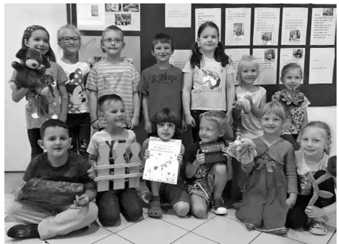
Die stolzen Autoren des Buches (Foto: Montessori-Kindergarten).

Alle Interessierten und Freunde sind herzlich eingeladen!