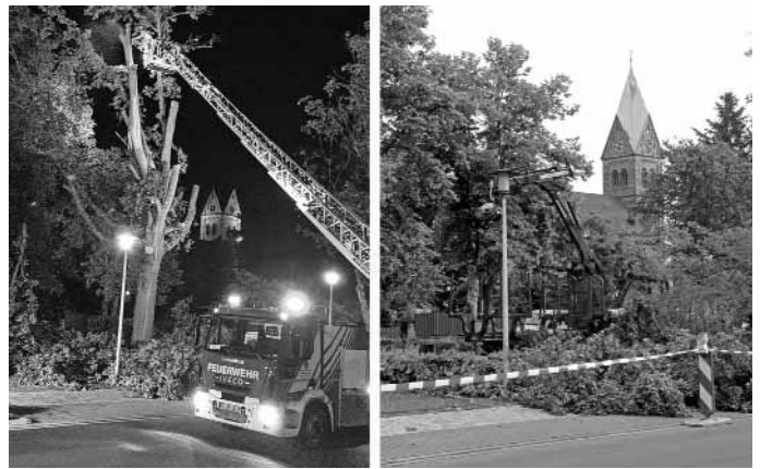
Mit Hilfe der Drehleiter konnte der Baum noch am Abend zurückgeschnitten werden.