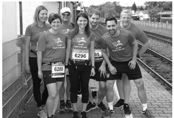
Zeigte sich optisch und beim Lauf einheitlich: die Verbandsgemeindeverwaltung Ramstein-Miesenbach.