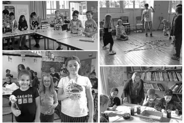
Bei vielen verschiedenen Aktivitäten kamen sich die Jungs und Mädchen aus beiden Schulen näher (Fotos: Wendelinusschule).

Address: Burgruine Moschellandsburg, 67823 Obermoschel