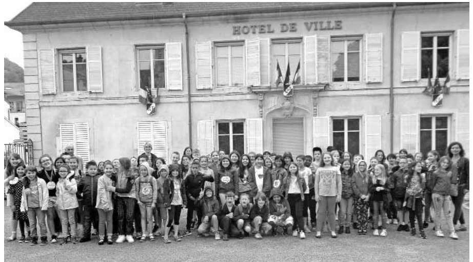
Die beiden Klassen der Wendelinusschule mit ihren französischen Gastgebern vor dem Rathaus in Maxéville.

Die Klassen 4b und 4d der Wendelinusschule besuchten am Dienstag, dem 29. Mai, die Partnerschule André Vautrin in Maxéville. Nach zwei Stunden Fahrt kamen wir endlich an. Dort wurden wir vom Schulleiter, dem Bürgermeister und einer Vertreterin des Partnerschaftsausschusses begrüßt. Unsere Partner sangen für uns deutsche und französische Lieder. Nach der Zusammenführung der Partner durften wir erst einmal gemeinsam spielen. Dann gingen wir in die nahege-