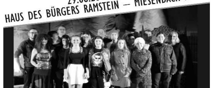
ein Projekt des JUGEND-TREFF-ZENTRUMS OTTERBACH