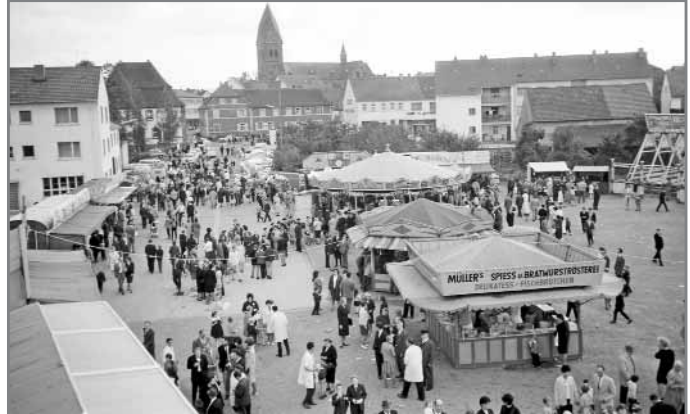
Der Kerweplatz Ende der 1960er Jahre auf den Rathauswiesen.

Der Erlös ist für die Anschaffung von Spielgeräten gedacht. Einlass für Verkäufer ist um 10.30 Uhr. Die Tischmiete beträgt 8,00 Euro. Anmeldung unter der Telefonnummer 06371 71851. Sie können beim Besuch gemütlich ein Kaffee trinken oder selbstgebackenen Kuchen und Pizza Waffeln essen.