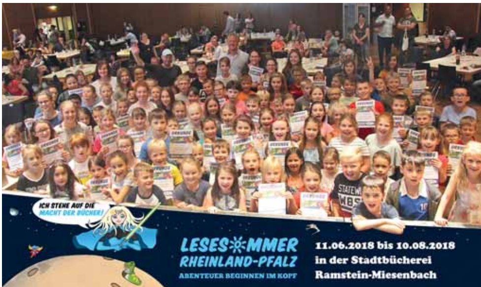
Das große Gruppenfoto nach der Urkundenüberreichung.

In diesem Jahr sind aus datenschutzrechtlichen Änderungen alle Kinder gehalten, mit ihrer Urkunde in den Schulen eigenständig den Eintrag ins nächste Halbjahreszeugnis zu veranlassen.