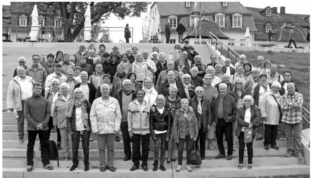
Mehr als 100 Personen aus Maxéville und Ramstein-Miesenbach kamen zum Partnerschaftstreffen zusammen. Das Gruppenfoto entstand zum Abschluss an der Schiffsanlegestelle in Trier.