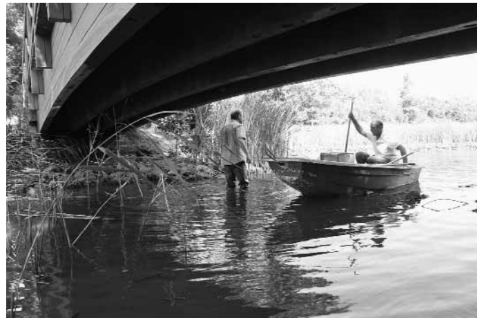
An dieser Stelle wird die neue Wassertrennwand eingebaut.

Montag bis Freitag 7.00 – 16.00 Uhr Samstag 9.00 – 12.00 Uhr