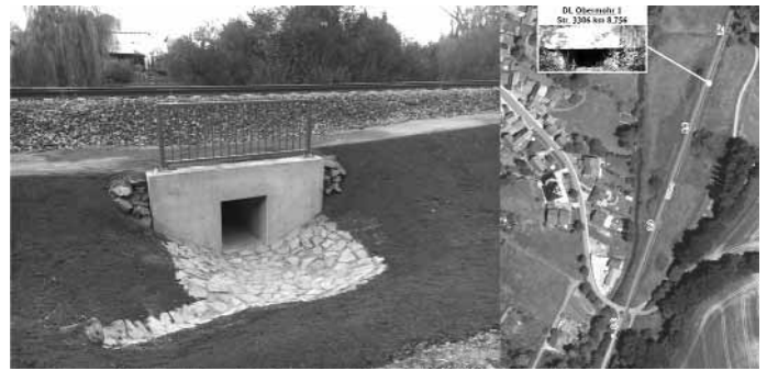
Einer der beiden errichteten Durchlässe in Obermoor.