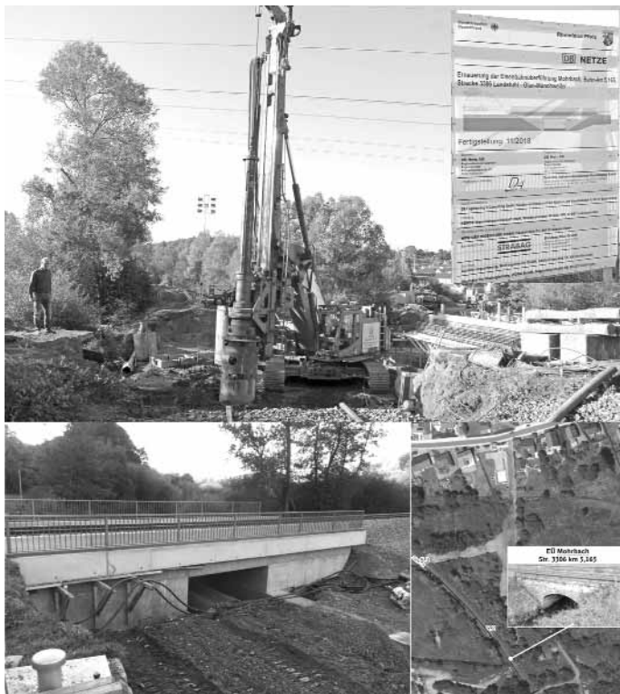
In Rekordzeit wurden die Baumaßnahmen umgesetzt. Hier Eisenbahnführung Mohrbach zwischen Ramstein und Miesenbach.

If you have any questions about the local area, please do not hesitate to contact the "Window to Rheinland-Pfalz – Ramstein Gateway" information center located in the Kaiserslautern Military Community Center (KMCC) on Ramstein Air Base: Window to Rheinland-Pfalz Ramstein Gateway Building 3336 (KMCC) 66877 Ramstein Air Base Phone: 06371- 406 208. E-Mail: kmcc@infocenter-ramstein.de www.ramstein-gateway.com