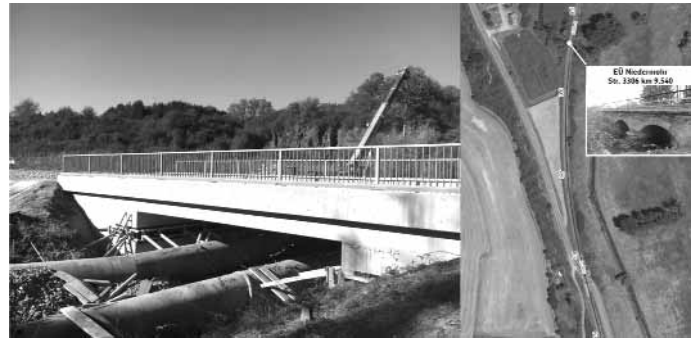
Die Eisenbahnüberführung in Niedermoer.