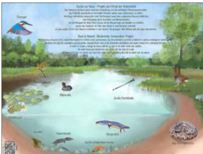
Die beiden Preisträgerinnen haben die Infotafeln für den Seewoog gestaltet.

Die Kreuzhofkapelle in Ramstein ist über die Osterfeiertage geöffnet. Der 1. Stadtbeigeordnete Ludwig Linsmayer hat die Kapelle gereinigt und sorgt dafür, dass die Türen auf sind. Gerne können Sie über die Feiertage bei einem Spaziergang an der Kapelle vorbeischaun und eintreten, selbstverständlich einzeln und mit dem notwendigen und vernünftigen Abstand.