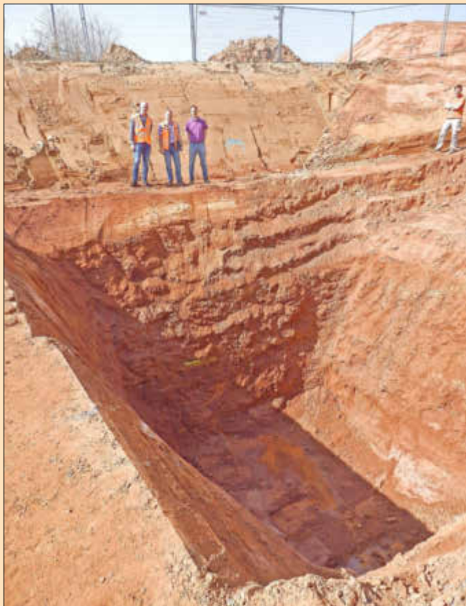
In 9,50 Meter Tiefe wird der Durchstick des Bohrers erwartet.

Derzeit werden die Tiefbauarbeiten zur Kanalerweiterung im Industriezentrum Westrich in Ramstein durchgeführt. Dabei werden ein Schmutzwasser- und ein Regenwasserkanal auf einer Länge von rund 70 Meter neu verlegt. Der Einbau der Kanäle erfolgt in zwei Stahlschutzrohren, welche im Bohr-Press-Verfahren durch das anstehende Felsgestein eingebracht werden. Mit der Kanalerweiterung wird das nördlich der Firma Rettenmeier gelegene Industriegelände erschlossen und an den bestehenden Kanal angebunden.