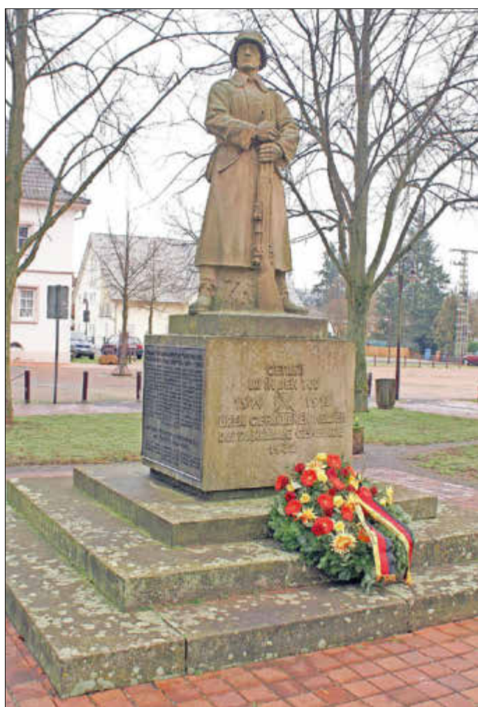
Ehrenmal in Miesenbach.