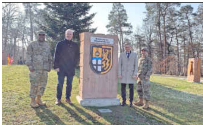
Einer der fünf Steine trägt auch das Wappen der Verbandsgemeinde Ramstein-Miesenbach.