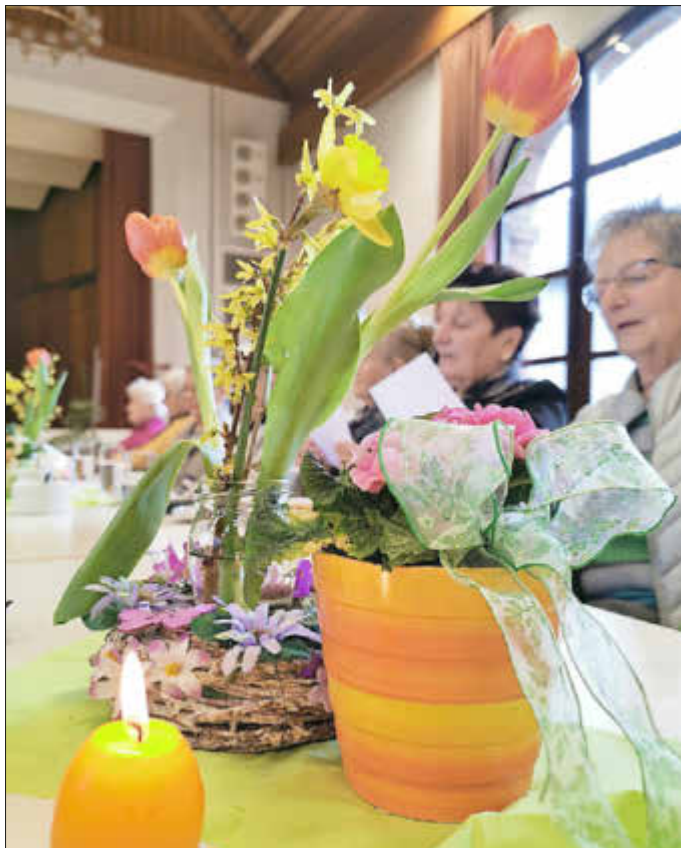
Toll dekoriert waren die Tische beim Treffen der „Gemütlichen Runde“ - da kam Osterstimmung auf.

Am Ende der Veranstaltung waren sich die Teilnehmerinnen und Teilnehmer einig: Die „Gemütliche Runde“ ist ein unverzichtbarer Bestandteil des Hütschenhausener Veranstaltungskalenders.