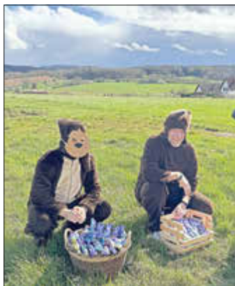
Volle Körbe mit Schokohasen hatten die beiden Osterhasen den Kindern mitgebracht.

Am Donnerstagnachmittag fand in der Kindertagesstätte „Sterntaler“ in Niedermohr eine Osterwanderung statt. Am frühen Nachmittag versammelten sich alle Erzieher*innen und Kinder mit ihren Familien auf dem Hof der Kindertagesstätte, um anschließend gemeinsam aufzubrechen. Bevor die gemeinsame Wanderung begann, wurden alle Familien mit einer kurzen Rede begrüßt.