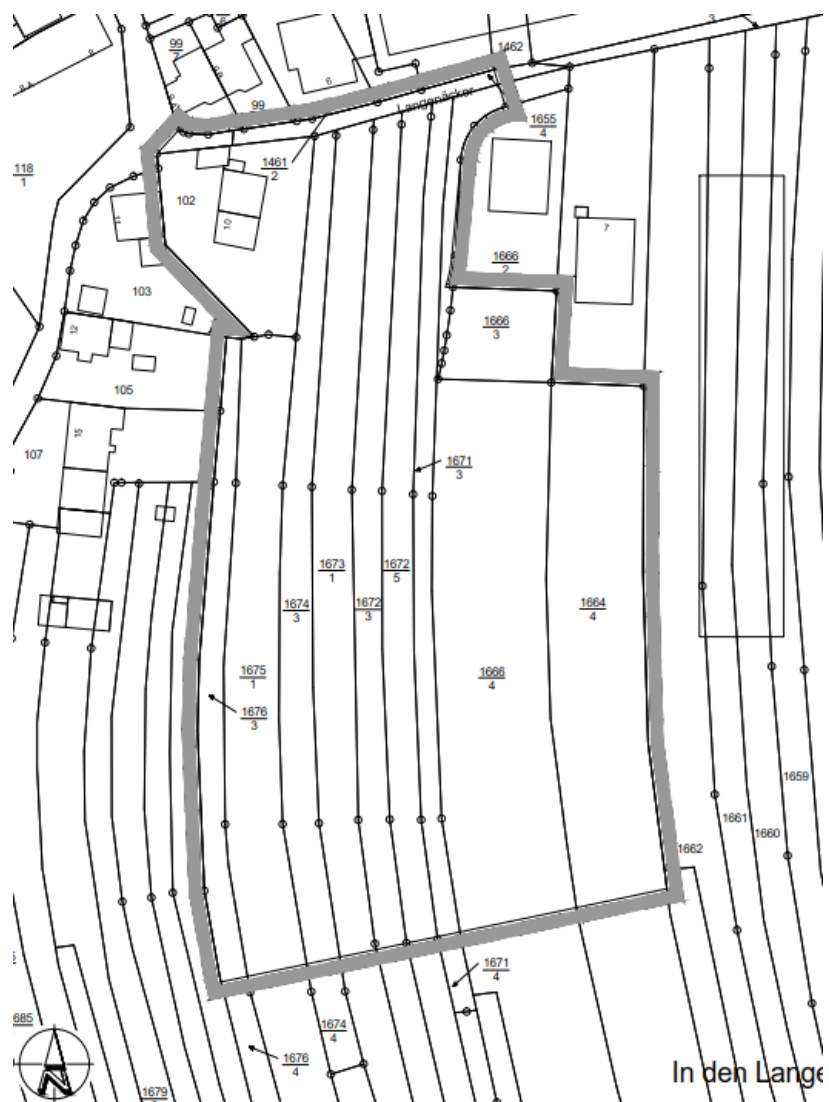
Abbildung 1: Geltungsbereich des Bebauungsplanes "Langenäcker"