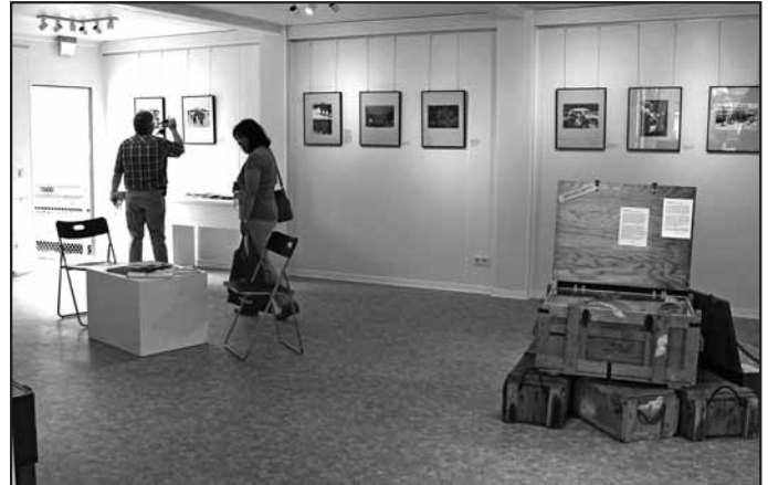
Ein Blick in den neuen Ausstellungsraum.

Aus Richtung Kusel erfolgt die Umleitung über Offenbach-Hundheim - L372 überörtlich über Nerzweiler, Hinzweiler, Oberweiler im Tal, Eßweiler, Rothselberg, Kollweiler, Schwedelbach, Weilerbach und aus Richtung Mackenbach in entgegengesetzter Richtung.