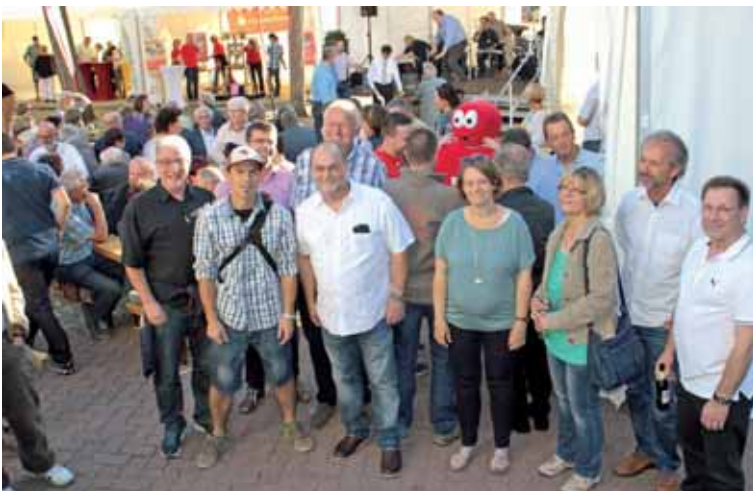
Mitglieder des Stadtrates, die der Einladung zur Jubiläumsfeier gefolgt waren.