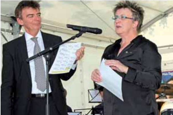
Die Vorstellung der Jubiläums-Briefmarken