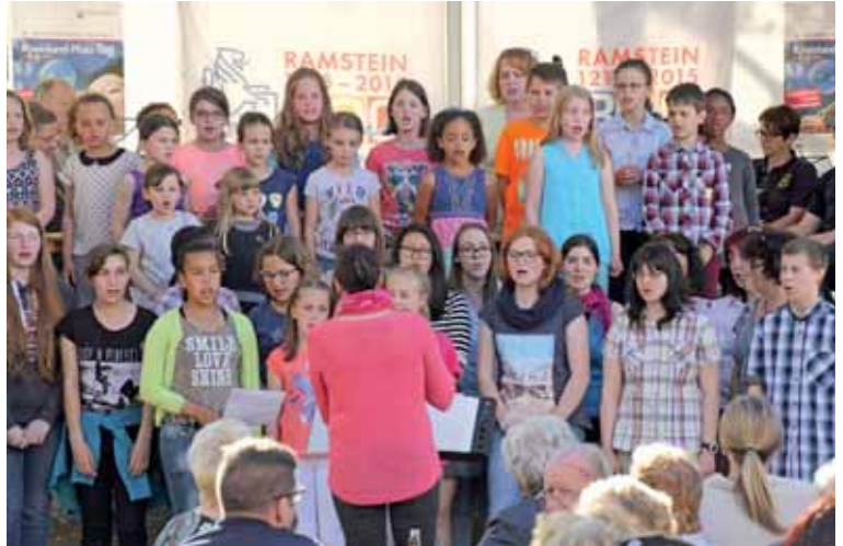
Der Kinder- und Jugendchor der Stadt sorgte gemeinsam mit der Stadtkapelle Ramstein-Miesenbach für die musikalische Umrahmung der Veranstaltung.