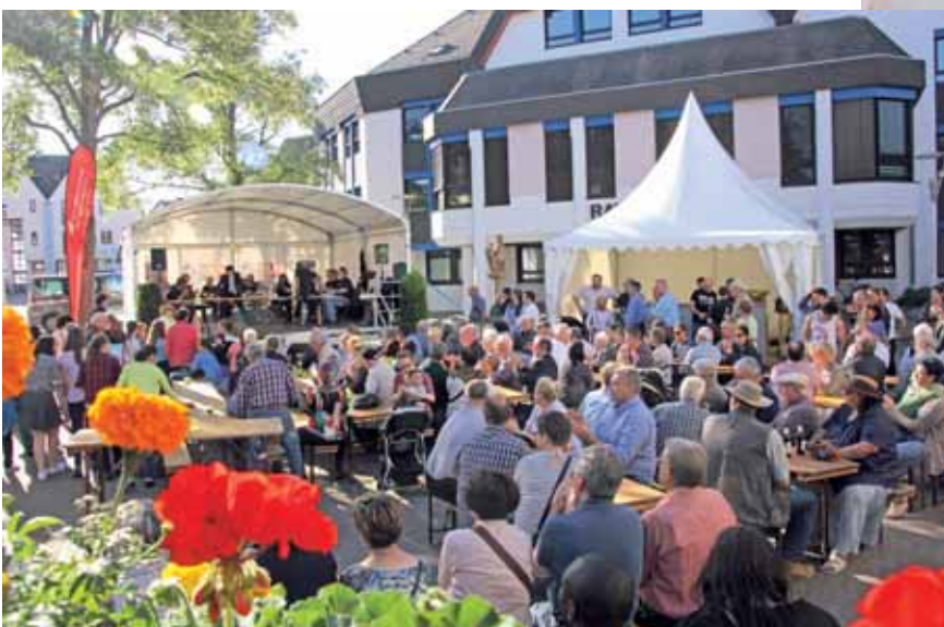
Gut besucht war die Veranstaltung am Jubiläumstag der Stadt, dem 2. Juni.