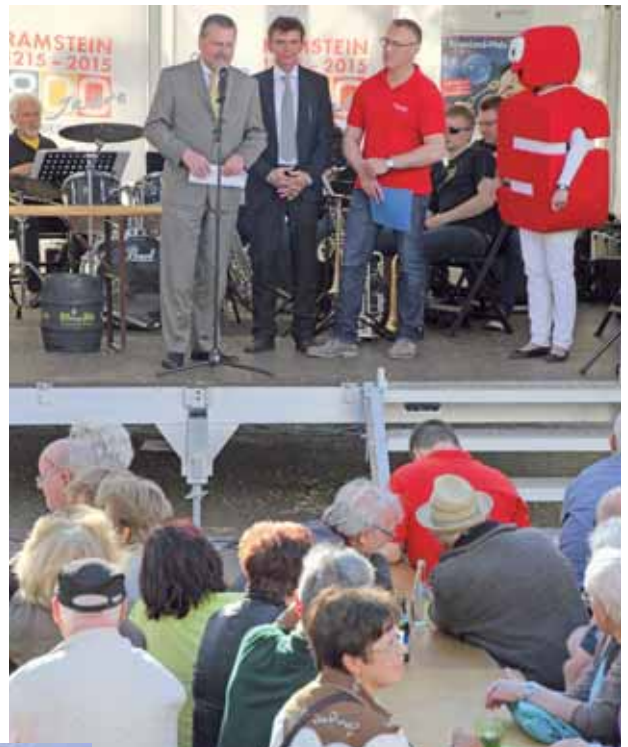
Die Vorstellung der Sondermünze der Kreissparkasse