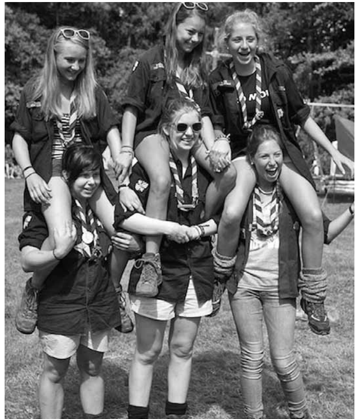
Die Pfadfinder freuen sich auf den Rheinland-Pfalz-Tag!

Mitmachaktionen und ein Informationsstand werden auf dem Rheinland-Pfalz-Tag in Ramstein einen Einblick in die Pfadfinderarbeit geben. Mit dem „Laufenden A“, Riesenseifenblasen und anderen Überraschungen werden der Bund der Pfadfinderinnen und Pfadfinder aus Kaiserslautern und Ramstein aktiv auf dem Rasenfeld im Reichswald-Stadion bei Sport, Spiel und Freizeit den Gästen ein kurzweiliges Programm mit Informationen anbieten. Ein Bunter Jugendverband freut sich auf einen bunten Rheinland-Pfalz-Tag 2015.