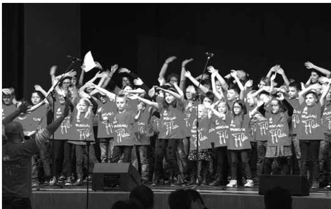
Die Schüler der Wendelinus-Grundschule bei ihrem Auftritt.